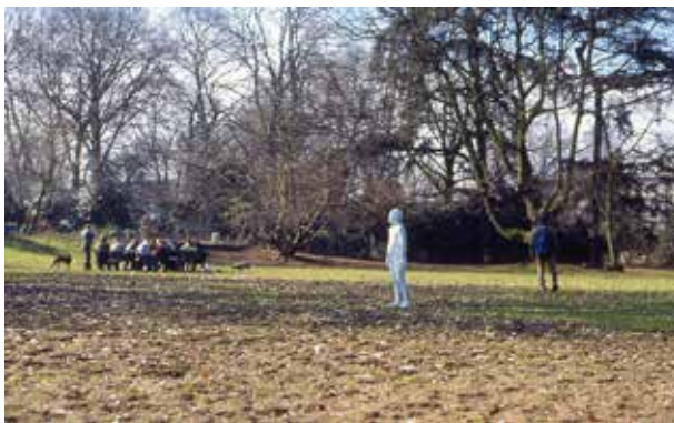
"skin hole / skin sense" Project [ #01 Düsseldorf ] 2003年