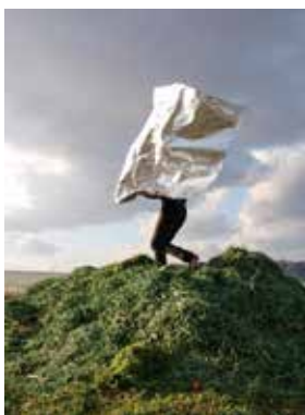
《Fragment-牧草の山でパフォーマンス》