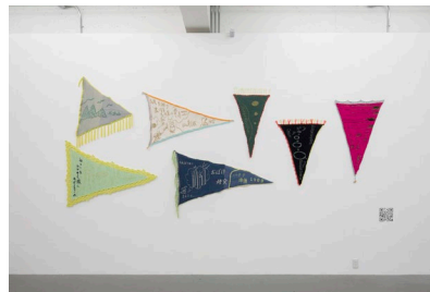
《港のお土産》2021