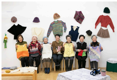
「こんにちは！港まち手芸部です。Vol.4」2021